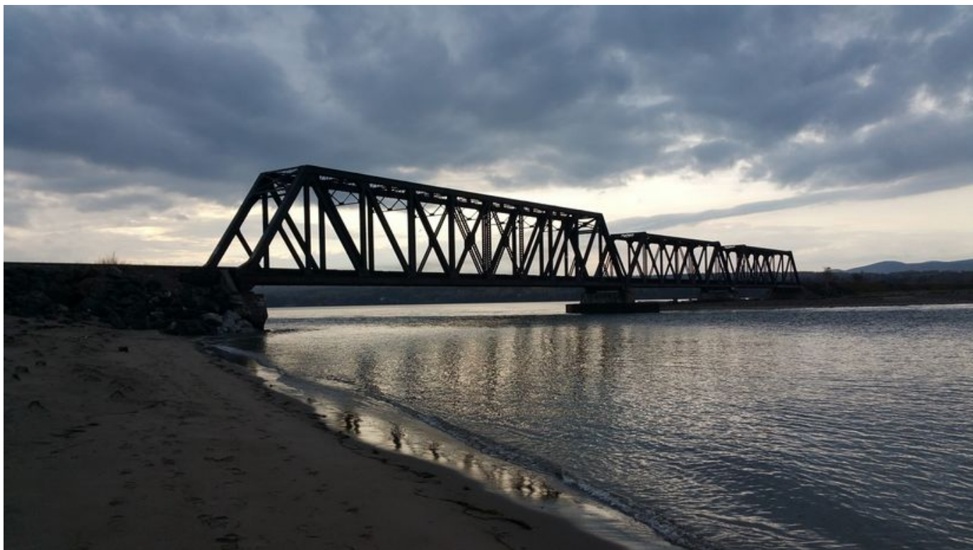
Structure ferroviaire dans le secteur de Douglastown, à Gaspé.

portée seront connues au terme de la nouvelle planification des travaux.