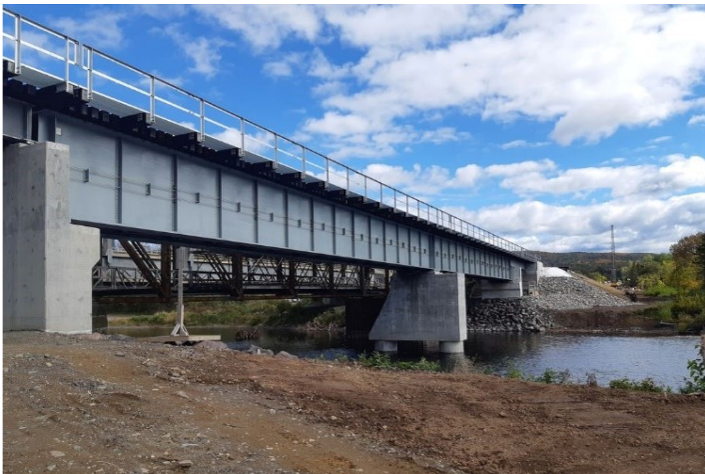
Nouveau pont construit au-dessus de la rivière Cascapédia à Cascapédia-Saint-Jules.

Le tronçon reliant Matapédia et Caplan, long de 126 km, est déjà en exploitation. Sa réhabilitation nécessitait notamment la reconstruction de deux ponts à Cascapédia-Saint-Jules.