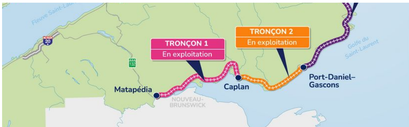
Carte illustrant les trois tronçons du chemin de fer de la Gaspésie entre Matapédia et Gaspé.